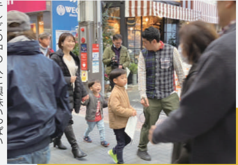
▲「冬のレシート集めてハッピーチャンス」ご一行

テレビの中の人に興味いっぱいの子供たち。今回のロケも「楽しそう！」と即参加を決意。はじめは声小さく緊張した様子でしたが、スタッフの皆さんの優しさですぐにいつもの調子を取り戻していました。