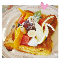
カフェ&レストランブルーローズ