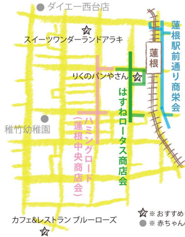
カフェ&レストランブルーローズ