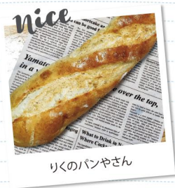
りくのパンやさん