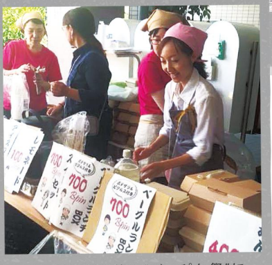
べっぴん隊主催の「べっぴん祭」にサポーターとして参加しました