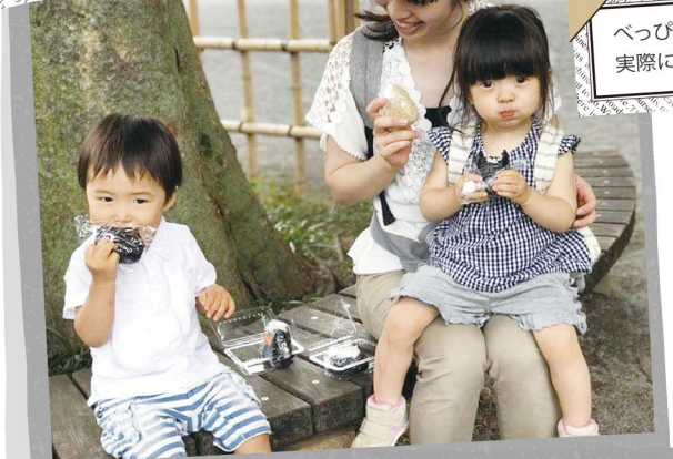
遊具は何もないけれど、おにぎりを食べるにはぴったりの「けやきの公園」