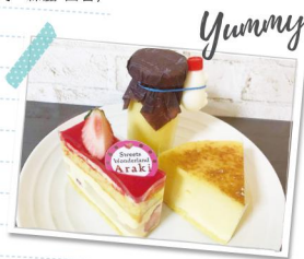
スイーツワンダーランドアラキ